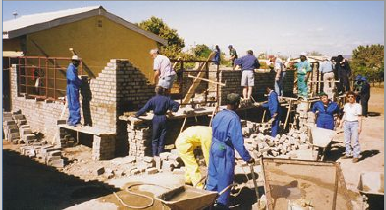
Unsere gemeinsame Baustelle

Im Sommer 1998 startete eine Gruppe aus Kernen zu einem „Workcamp“ im Old People`s Home Mucheke in Masvingo. Dieses Altenheim beherbergt etwa 35 ältere Menschen, die keine Verwandten besitzen. Gemeinsam mit afrikanischen Freunden und Fachkräften wurde der Bau eines Speisesaals errichtet.