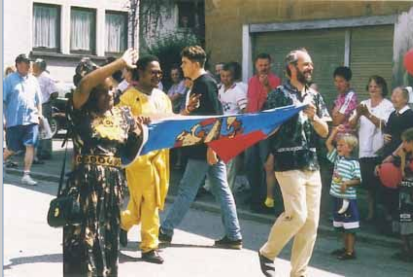
850-Jahr-Feier Rommelshausen 1996