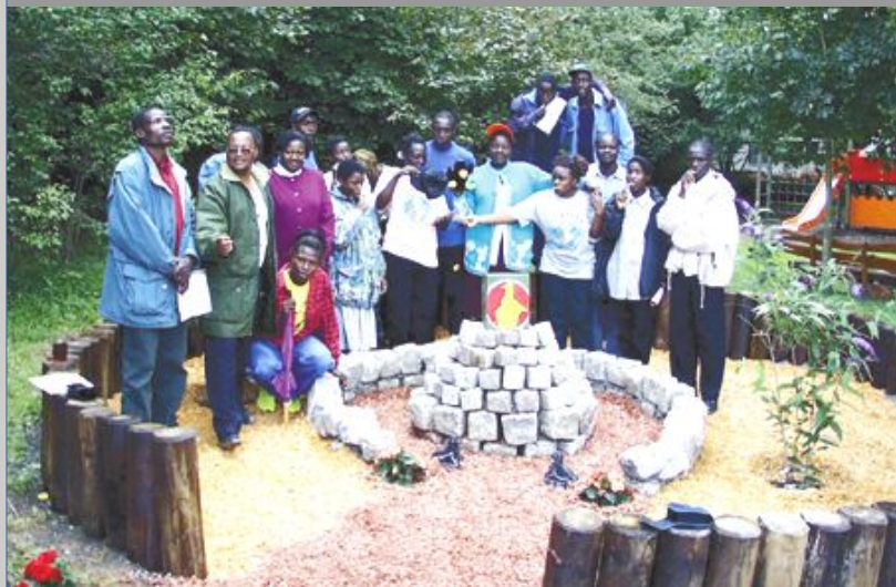
Jugendcamp 2000 Ländergarten in Kernen „Little Zimbabwe“