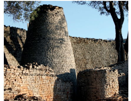
Weltkulturerbe „Great Ruins“ of Zimbabwe

Nahe der Stadt Masvingo erinnern monumentale, perfekt gefügte Mauern an eine afrikanische Hochkultur, die fast spurlos unterging. Auf Grund dieses historischen Bezugs entschied sich die Gemeinde Kernen eine Partnerschaft mit der Stadt Masvingo einzugehen, die 1990 in Masvingo unterzeichnet wurde.